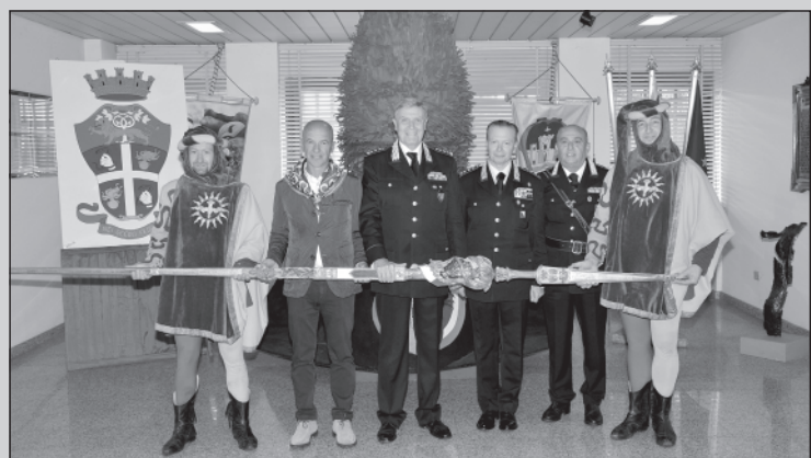
Nella prima foto: il generale di corpo d'armata Ugo Zottin, in visita al comando provinciale dei carabinieri di Arezzo, assieme al comandante provinciale colonnello Roberto Saltalamacchia, posa per una foto ricordo con il rettore Ezio Gori ricevuto per tale occasione con la Lancia d'Oro dedicata ai 200 anni dell'Arma dei Carabinieri. Nella seconda foto è il Quartiere che si fregia di accogliere al nostro museo, la sezione aretina dell'Associazione Nazionale dei Carabinieri in visita per toccare con mano la prestigiosa Lancia d'Oro.